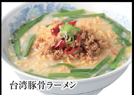
台湾豚骨ラーメン