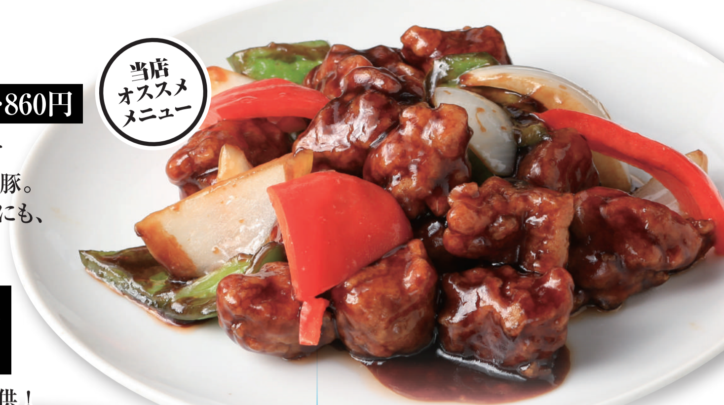
ラーズナー 辣子鶏(鶏肉の唐辛子炒め) .....780円

鶏肉とたっぷりの唐辛子を炒めたご飯のお供！ 見た目より辛さはなく、唐辛子の風味豊かに 仕上げた一品。