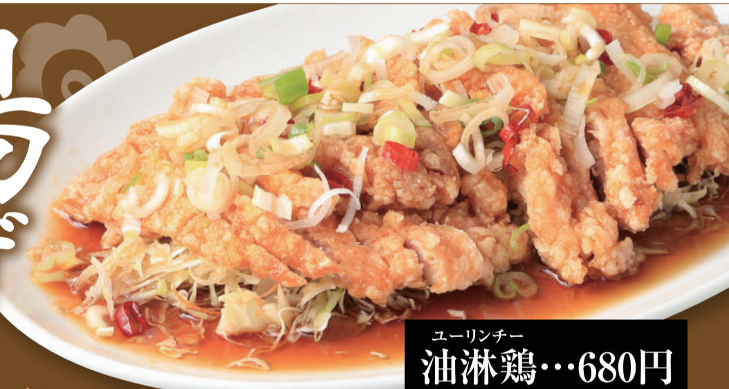
ユーリンチー 油淋鶏...680円