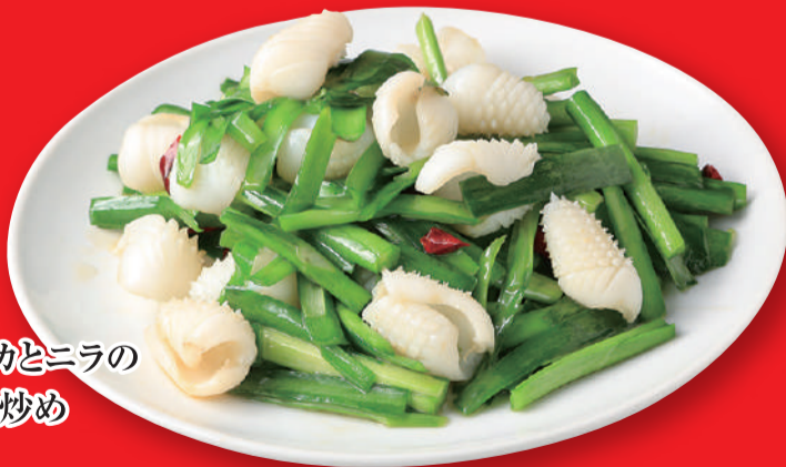
イカとニラの 塩炒め