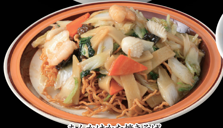
あんかけかた焼きそば