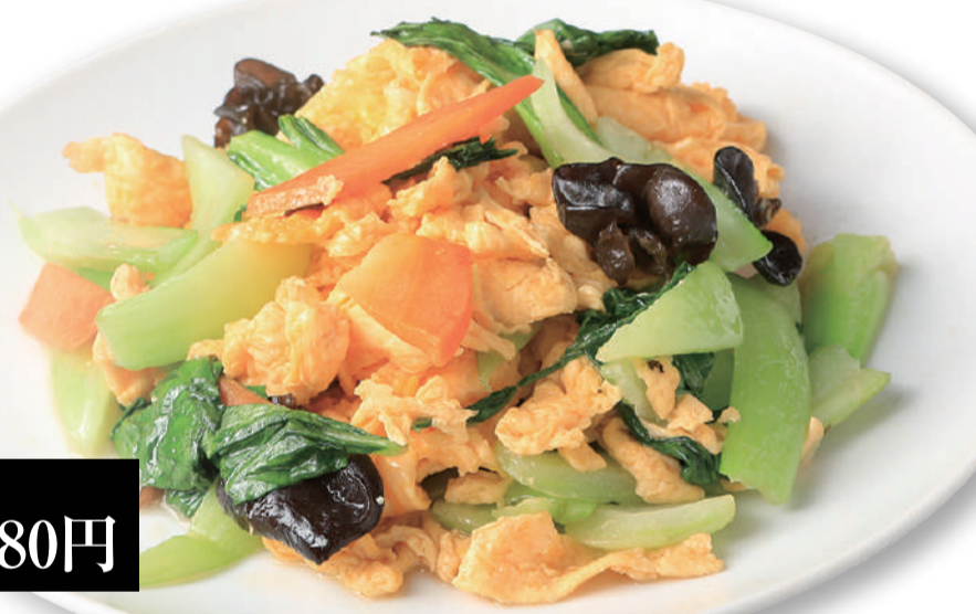
チンゲンサイ 青梗菜と卵炒め...680円