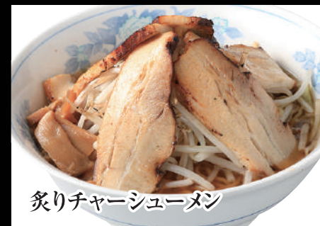
炙りチャーシューメン